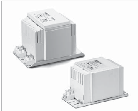
HID manyetik balastlara genel bakış

Herhangi bir manyetik ürün ihtiyacınız için lütfen bizimle iletişime geçin.